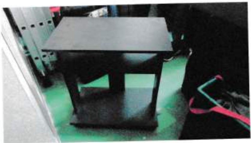
Archivador Metalico y Mesa de madera para Impresora