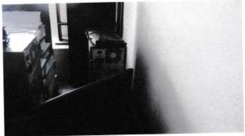
Computador (Clon) : CPU, Monitor Samsung y teclado