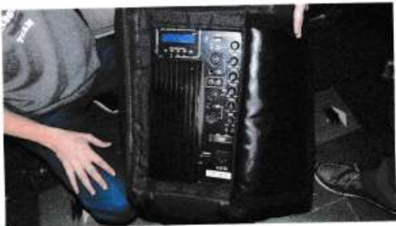
Cabinas de sonido SPAIN