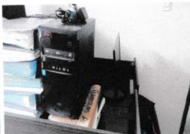
Escritorio de madera con dos gavetas y Computador (CPU HG y Monitor AOC)