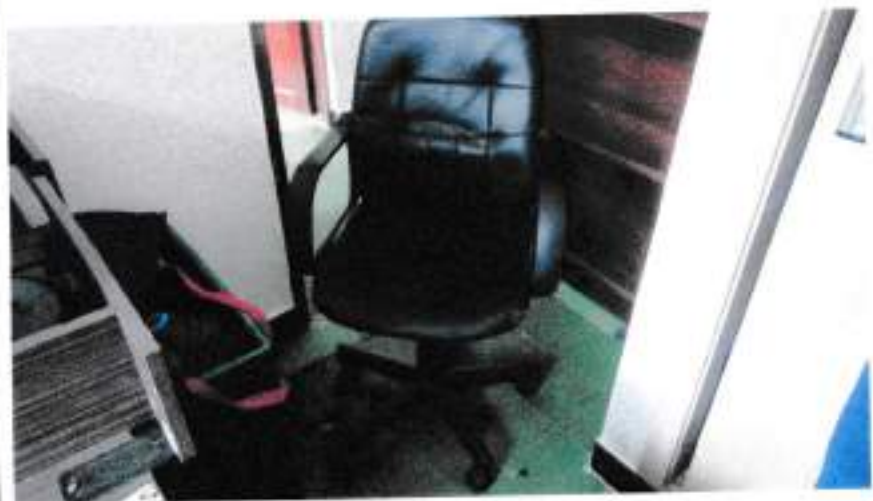
Sillas Fijas metálicas con revestimiento de paño y Silla Ejecutiva con rodachines y apoyabrazos