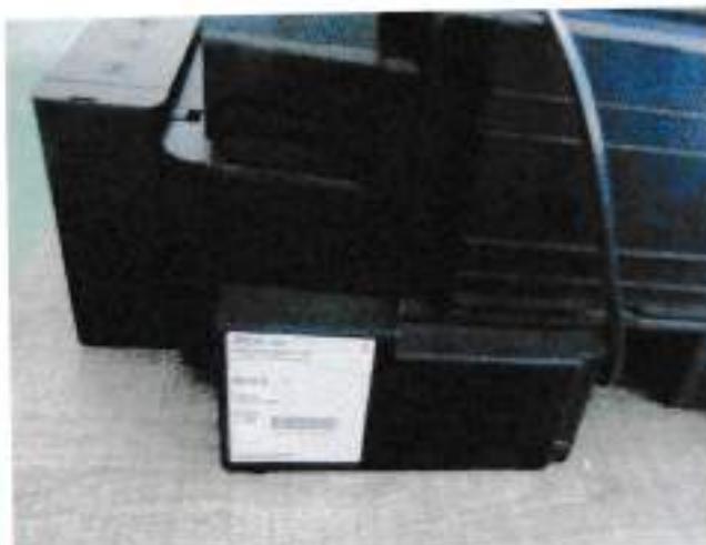
Impresora EPSON L555