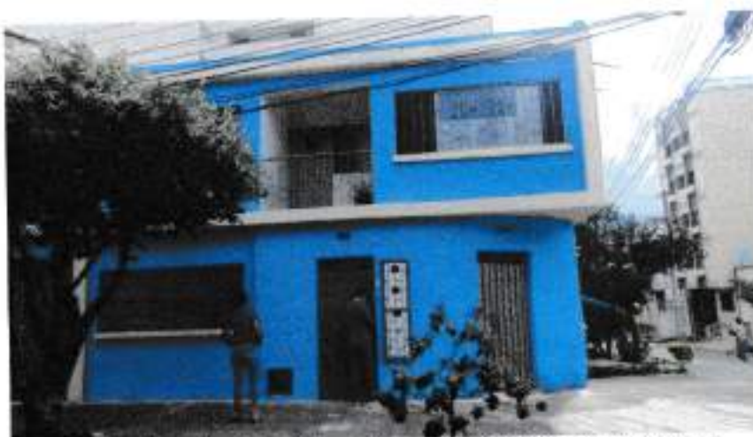
Sitio de ubicación de los Bienes (Carrera 29 N°13-06, La Universidad)